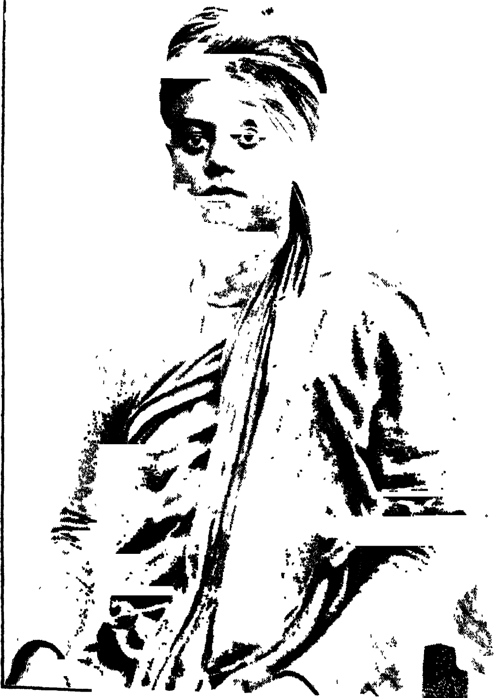
নরেন্দ্রনাথ ( স্বামী বিবেকানন্দ )